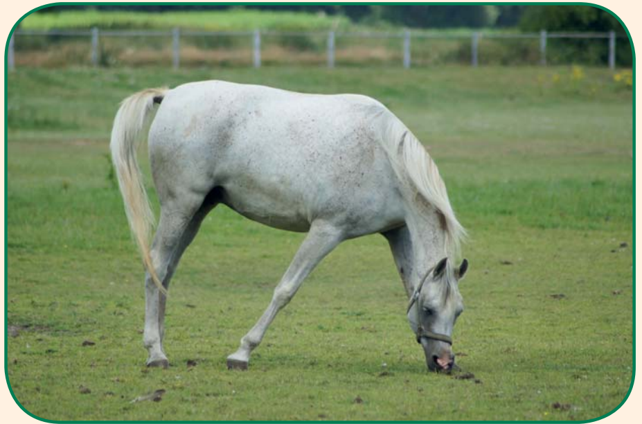
Jumet pur-sang arabe grise, haras Ismer, Allemagne

Le « gris » n'est pas véritablement une robe. Il s'agit en réalité d'un gène dominant qui recouvre entièrement la robe de base. Il en résulte une décoloration progressive de la couleur du poil. On parle de grisonnement. Le cheval gris, à la naissance, est d'une couleur foncée qui va s'éclaircir avec le temps, jusqu'à devenir presque blanc. Presque tous les chevaux gris ont un poil clair mais la peau et les yeux sont foncés. Les premiers signes du grisonnement apparaissent généralement vers l'âge d'un an, parfois dès la naissance. La tête est touchée en premier, au niveau des yeux et des naseaux, puis viennent les flancs et enfin l'ensemble du corps. Ce sont les crins qui s'éclaircissent en dernier. Il existe différentes teintes de gris : gris fer, gris pommelé, gris truité, gris souris, gris presque blanc. Les lipizzans et les camarguais sont presque toujours gris. Cette robe est très courante et souvent confondue avec le blanc qui, lui, est très rare.