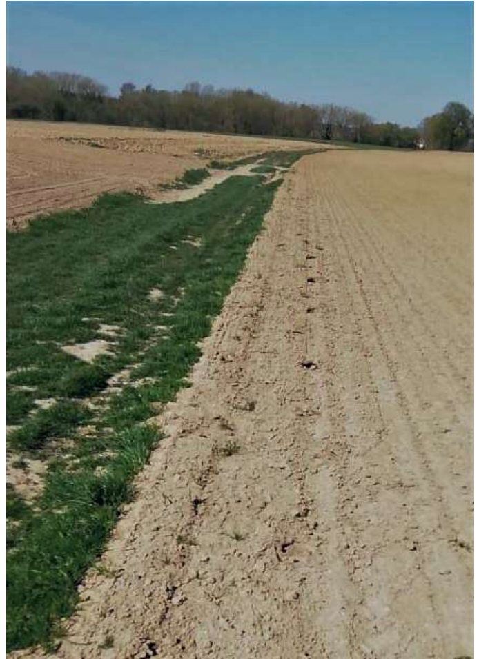
Dans un champ pourtant le long d'un bon chemin de terre