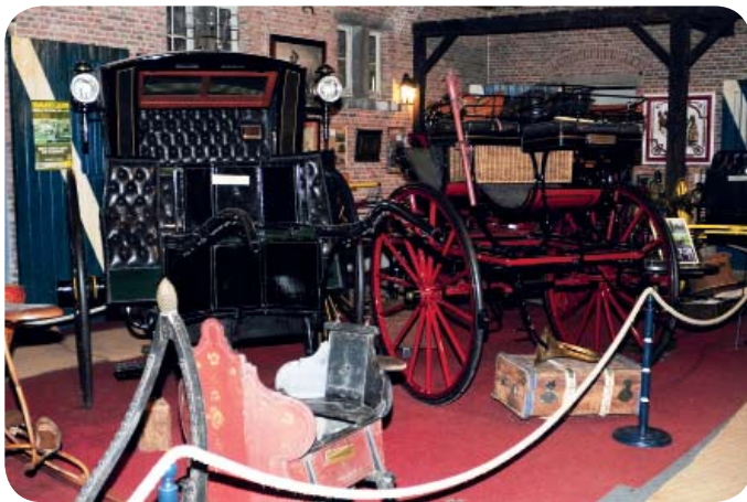
Cab londonien et wagonnette