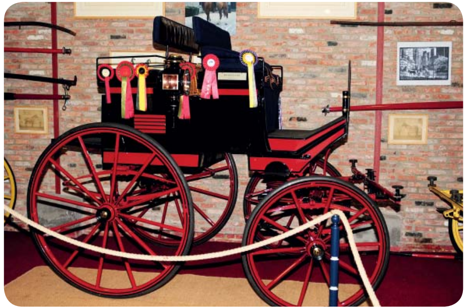
Break dog cart avec ses flots de récompense

Les ancêtres du Comte John II de Marnix de Sainte Aldegonde se sont illustrés au cours des siècles, occupants des postes importants à côté de nos dirigeants.